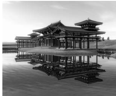
VRで再現された800年前の無量光院

寺院から発展した用水路 平泉町には、世界文化遺産の構成資産である中尊寺と毛越寺、現在は遺跡化した無量光院跡、観自在王院跡という12世紀に造られた4寺院が存在しますが、それぞれに大きな池を伴っています。そして発掘調査により、それらの池に水を満たすための導水路が発見されており、それが現在の照井堰用水の始まりと考えられています。