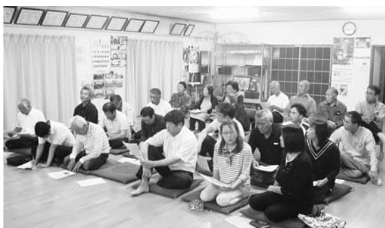
10区地域懇談会(6月27日)