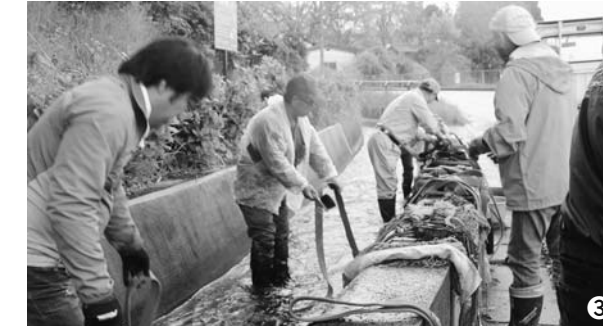
①_照井堰から毛越寺庭園への取り入れ口/②_庭園に注ぐ「遣水」/③_現在も洗い場として活用される照井堰用水

水田へのかんがい用水を引くために開削された照井堰用水は、田畑の作物に水を供給するだけでなく、飲用や雑排水はもろろのこと、防火用水、消雪用水、大雨時の治水、水辺の植物や水生生物の生活環境など、多様な領域に関わっています。また地域の景観を豊かにする親水空間を提供するなど、一関・平泉の各集落の地域環境を形成する核にもなっています。