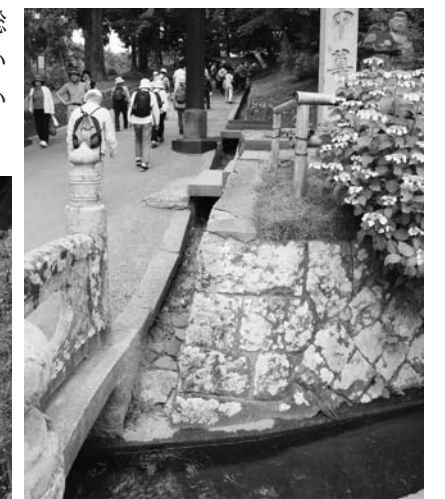
中尊寺の月見坂入口付近