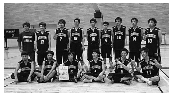
見事準優勝したメンバー