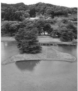
無量光院跡の本堂跡と東島

現在史跡整備を進めている無量光院跡の本堂跡と東島を限定公開します。整備された本堂跡と東島をぜひこの機会にご覧ください。 ■日時：8月4日(金)～20日(日) ■場所：特別史跡無量光院跡 ■問い合わせ先 文化遺産センター ☎46-4012