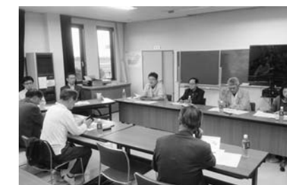
生母地区で行われた打ち合わせの様子