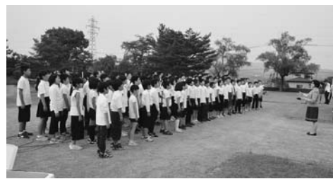
観自在王院跡に響き渡る5、6年生の歌声

「平泉世界遺産の日の6月29日「平和の祈り」が開催され、本年度も5・6年生が、世界平和と1日も早い復興の願いを込めて「平泉讃歌」を歌いあげました。その美しい歌声は参加者の思いとともに観自在王院跡に響き渡りました。