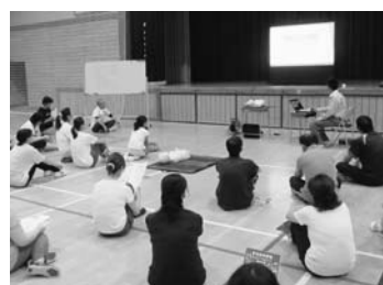
心肺蘇生法などを学んだ救命講習会

7月の週始めの日には「社会を明るくする運動」の朝のあいさつ運動で、関係者に声を掛けてもらい、子どもたちもおはようございますと元気なあいさつができました。