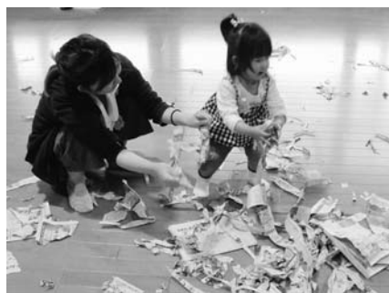
7月のびのびクラブ「新聞紙遊び」の様子