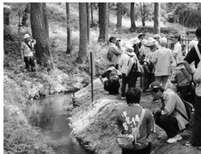
地域の水資源に理解を深める参加者

照井土地改良区などが主催するウォーキング。今年で第7回目を数え、照井堰用水や平泉の歴史を勉強しながら、約10kmのウォーキングが楽しめるとして町内外から多くの人が参加します。