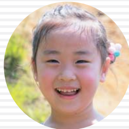
プリキュア・アラモード みやたねね 宮田寧音ちゃん