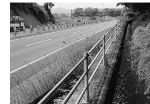
高速道路沿いを流れる照井堰用水

照井堰用水は全部で8路線あり、総延長は64kmにも及びます。町内を歩いていると、さまざまな場所で流れている水を見ることができます。