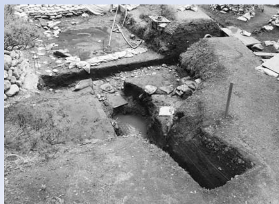
蝦蟇が池と調査トレンチ(北西から)

前産磁器1点が出土しました。近世以前の蝦蟇が池は、現在の池岸より西側に広がりをもっていた可能性があります。