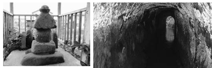
高春の墓と伝えられる「五輪塔」(一関市中里)