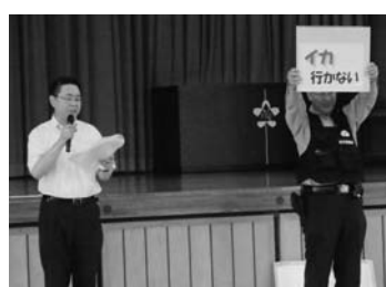
不審者対応防犯訓練

心肺蘇生法やAEDの使用などをスライドや実体験を通して学びました。夏休みプール監視当番の人も多数参加し、いざという時の備えとして貴重な講習会となりました。 14日には、一関警察署や長島駐在所にご協力をいただき、不審者対応防犯訓練を実施しました。校舎内に不審者が侵入したという想定のもと、放送の指示により避難した後、「いかのおすし」で不審者に対応することを学びました。