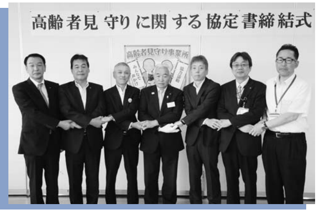
高齢者見守りに関する協定書締結式

6月27日、町保健センターで高齢者見守りに関する協定書締結式を行いました。高齢者が住み慣れた地域で安心して暮らせるよう地域での見守り体制の充実を目指し、民間事業者7者との間で連携協定を結びました。 各事業者は日常の業務の中で新聞や郵便物がたまっていく、異常な臭いがするなど高齢者の異変を察知した場合、協定に基づき、町保健センターに連絡するほか、緊急時には消防署や警察署に通報します。