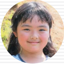
キュアマカロン とりはたきら 鳥畑咲良ちゃん