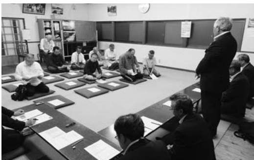
2区地域懇談会(5月24日)