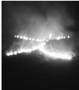
昨年の大文字送り火