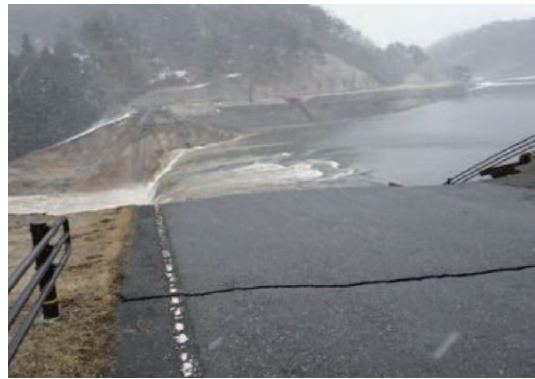
決壊直後の藤沼湖

このハザードマップは、ため池が決壊した場合に想定される浸水区域を予測し地図化しており、皆さんが安全に避難できるために必要な情報が記載されています。