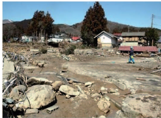
濁流が襲った集落