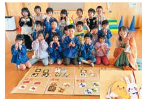
↑宝物探して遊びました みんなで作ったちょうちん→

当日は中秋節のお話や宝物探し、うさぎのちょうちんづくりなどを行い、子どもたちは楽しみながら中国文化に触れることができました。最後には「謝謝!(ありがとう)」の声も聞かれ、温かい交流の時間となりました。