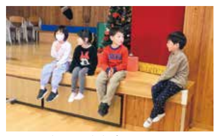
なかよく交流しました

町が取り組む「架け橋期プログラム」(小学校と保育所のスムーズな連携・引き継ぎを目指す取り組み)の一環で、長島小学校の1年生と長島保育所の年長児による「なかよし交流会」が行われました。会では、まず、1年生が生活科で制作した手作りおもちゃを紹介し、遊びました。その後、1年生と年長児がペアになり、体を動かしたり言葉で伝えたりしてさまざまなミッションに取り組む「ジャンボすごろく」を楽しみました。本プログラムのテーマは「言葉による伝え合い」です。1年生が遊び方などを教えた年長児が教わったり、ペアでしりとりを