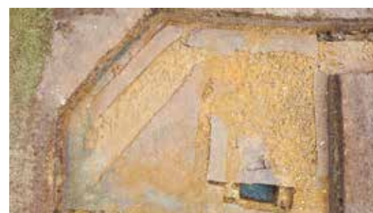
写真3 新しい石敷(1区、南側から撮影) 東側より西側の方が石が少ない様子が分かります。