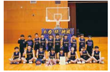
地区大会優勝を飾り、県大会出場を勝ち取った平泉ミニバス(男子チーム)の選手たち

一関市大東体育館と東山総合体育館を会場に、11月29～30日、12月6～7日の4日間の日程で第49回岩手県ミニバスケットボール交歓大会地区予選が開催されました。男女チームがそれぞれ出場した平泉ミニバスケットボールスポーツ少年団は、男子チームが見事優勝し、1月10～12日に盛岡市市民総合体育館で開催されるJ A全農いわていわて純情米選手権第49回県ミニバスケットボール交歓大会への出場を勝ち取りました。試合結果は次の通りです。