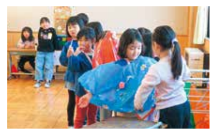
交流会では笑顔が見られました

令和7年11月13日、1年生の教室で町立幼稚園・平泉保育所の年長さんと本校1年生の交流会がありました。この交流会は、来年度1年生になる年長さんが小学校に入学してから円滑に小学校生活になじめるようにするために実施されました。交流会は、1年生が司会となって会を進めました。生活科でドングリなどを使って作った作品をお店に出して、お客さんの年長さんに楽しんでもらおうというものです。「いらっしやい、いらっしやい」と呼び込んだり、やり方の説明をしたりして、年長さんをもてなしていました。みんな楽しそうな様子でした。