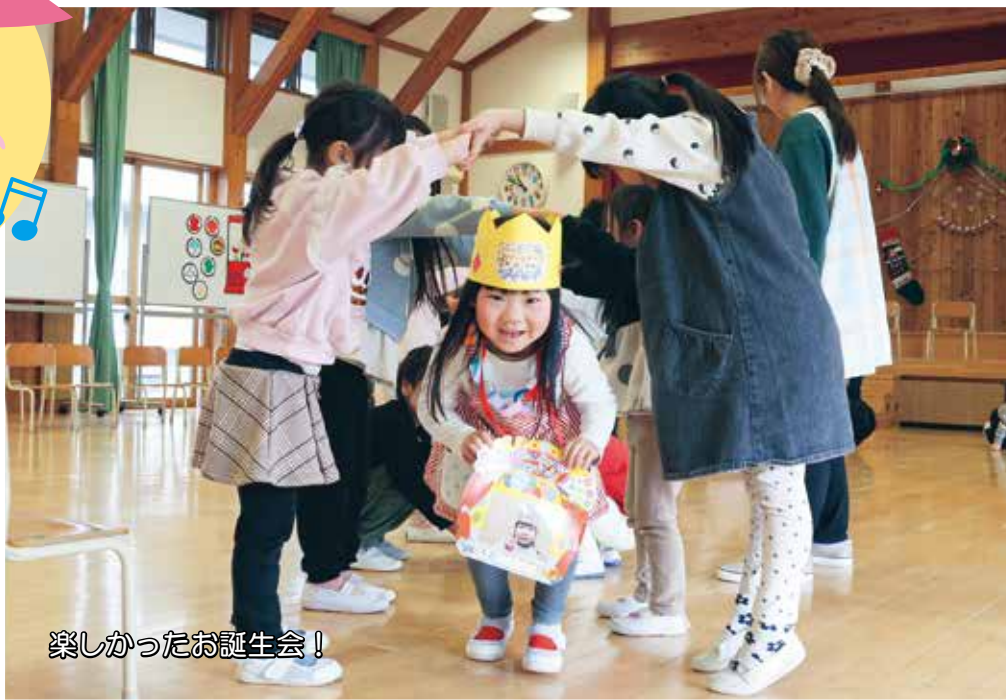
楽しかったお誕生日会！