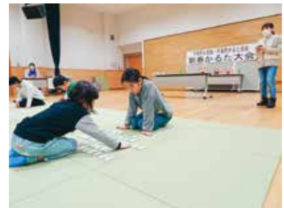
昨年のかるた大会の様子