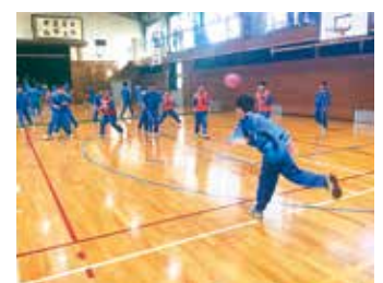
白熱したドッジボール

令和7年12月10日、1、2年生の新体制となった生徒会執行部が学年を超えた交流を通して全校の仲を深め、明るい学校にしたいことを目的とした「クラスマッチ」を企画し、実施しました。種目はバレーボールとドッジボールのスポーツ競技のほかに、お絵描き伝言ゲーム・創作俳句といった思考をしながら楽しめるゲームの計4種目で、生徒たちは1種目以上に出場しました。どの種目でも、競技した人たちはもちろん、応援している人たちから拍手や声援が響き渡るなど、笑顔が多く見られました。また、運営を行った生徒会執行部の生徒も声を掛け合いながら、スムーズに行事を行えることができました。生徒の感想を紹介します。・勝敗にこだわらずに楽しく活動できたからよかった。・平中は小規模校なので、学年を超えた活動や交流はとても大事だと思った。学年を問わず、互いに良さを認め合い、クラスの一体感がさらに高まるよう盛り上げたり、相手を称えたりすることができたと思った。