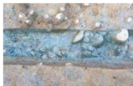
写真4 古い時期の石敷(1区、南側から撮影) 一段低いところから古い石敷が見つかりました。

向に延びています(写真2)。 1㍎3区で見つかった石敷は、昨年までと同様に、新旧2時期あることが分かりました。 新しい時期の石敷は、2㍎6㍎の小ぶりの石で構成されています。東側は比較的良く残っていますが、西側は部分的に失われてしまっています(写真3)。 これは、地形的に水で流されてしまったことと、後世の田んぼの耕作によって取られてしまったことが原因と考えられます。 古い時期の石敷は、10㍎前後のやや大ぶりの石で構成されています(写真4)。 4㍎5区は次号で紹介する予定です。