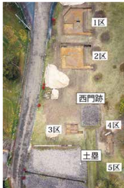
写真1 調査区全景(上が北) 観自在王院跡北西側の西門跡北側を調査しました。西門より南側では土塁と石敷の南北道路が整備されています。