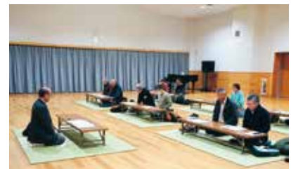
昨年の謡曲教室の様子