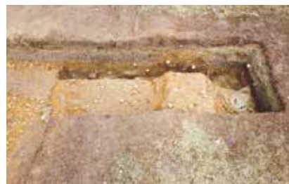
写真2 土塁(1区、南側から撮影) 土を層ごとに薄く突き固める版築技法ではなく、土を盛土して作られていました。