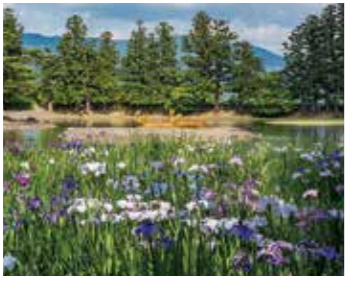
毛越寺あやめまつり