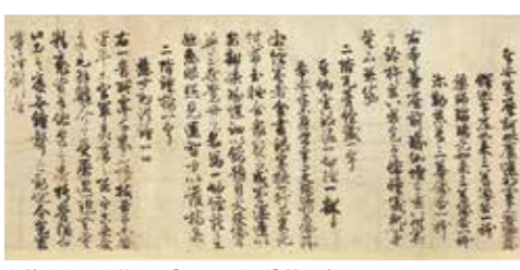
中尊寺建立供養願文[重要文化財](部分)