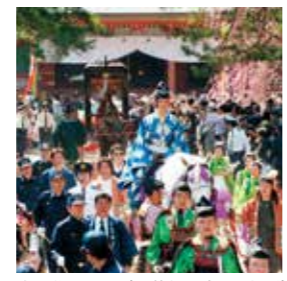
春の藤原まつり(源義経公東下り行列)