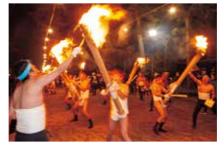
毛越寺二十日夜祭