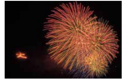
平泉大文字送り火