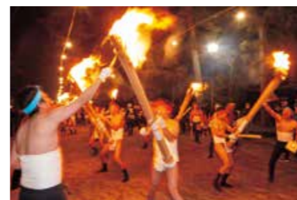
毛越寺二十日夜祭