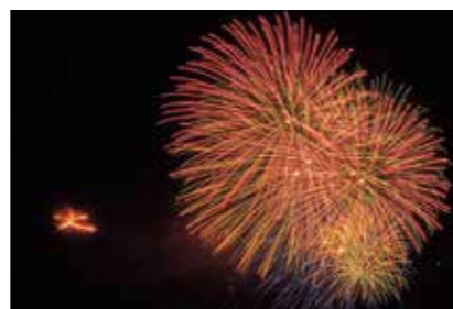
平泉大文字送り火