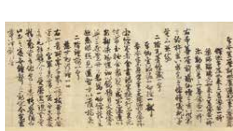
中尊寺建立供養願文[重要文化財](部分)