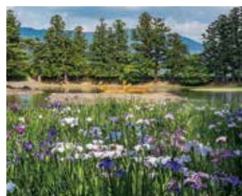
毛越寺あやめまつり