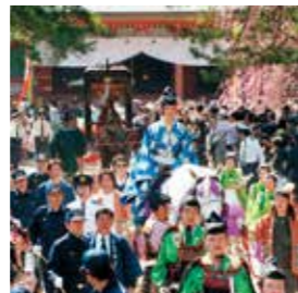
春の藤原まつり(源義経公東下り行列)