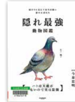
「隠れ最強動物図鑑」 今泉 忠明 // 監修 / サンマーク出版