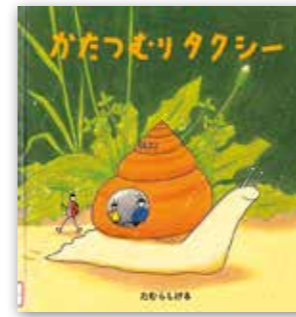
「かたつむりタクシー」 たむら しげる // 作・絵 / 福音館書店