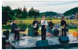
昨年のジャズフェスの無量光院跡ステージ