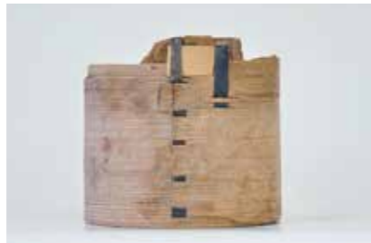
写真3 志羅山遺跡出土の曲物(まげもの)