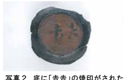
写真2 底に「吉吉」の焼印がされた漆器皿