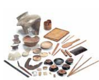
写真1 追加指定品の集合写真

価された151点について、国の文化審議会は重要文化財に追加指定するよう、令和8年3月26日に文部科学大臣に答申しました(写真1)。これらの遺物は令和8年内に正式に重要文化財に追加指定される見込みです。