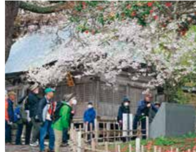
第1回ウォーキング教室の様子