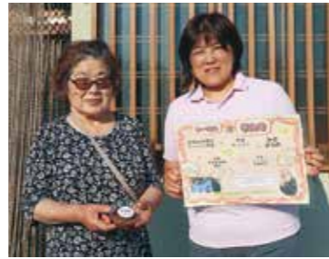
ヤコン甘辛味噌を紹介する長島味噌研究会のメンバー

でも食べられます」と勧めます。町内産のヤコン、ニンニク、赤唐辛子や、ミカンで作られる静岡県産の酢、サトウキビ100%の沖縄県産の黒糖などが使用され、ピリッと甘辛く食感も楽しめる味わい。「とにかく材料にこだわっています。作り方は企業秘密ですが、一生懸命愛情を込めて作っていますので、ぜひお買い求めください」と語ります。