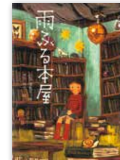
「雨ふる本屋」 日向 理恵子 // 作 / 童心社