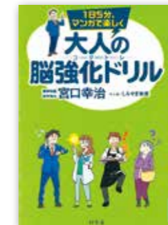
「1日5分、マンガで楽しく大人の脳強化ドリル」 宮口 幸治 // 著 / 幻冬舎