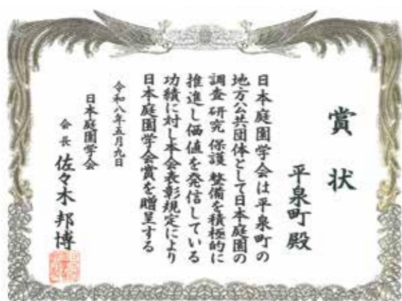
令和8年度日本庭園学会賞の賞状

令和8年5月9日に開催された日本庭園学会総会において、平泉町が令和8年度の日本庭園学会賞を受賞しました。 この賞は日本庭園とそれに関わる研究に関する業績を顕彰するもので、町がこれまでに、毛越寺、観自在王院跡、無量光院跡をはじめとする庭園の調査研究・史跡整備や周辺景観との調和において先駆的役割を果たし、日本庭園史研究の深化に寄与したことが高く評価され、受賞に至りました。地方公共団体としては初の受賞です。