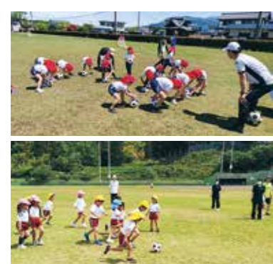
サッカー教室の様子

出前スポーツ教室は、PTAや行政区など、町内団体も開催できます。開催を希望する場合は教育委員会事務局に問い合わせください。(詳細は広報ひらいずみ5月号を確認してください。)