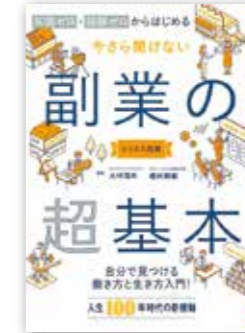
「今さら聞けない副業の超基本」 大村 信夫・榎村 周磨 // 監修 / 朝日新聞出版