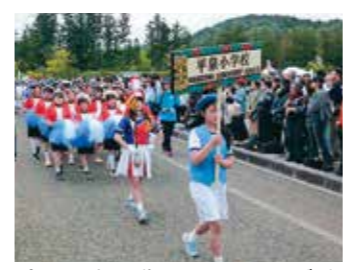
本行列を先導したマーチング隊

5月3日に開催された「春の藤原まつり」に、本校の5・6年生がマーチング隊として参加しました。本年度は午後の本行列の先導を担当。多くの観客に驚き、緊張した表情でスタートしましたが、子どもたちは、そろいの演奏と堂々とした行進を披露し、沿道の人たちから大きな拍手を受けました。