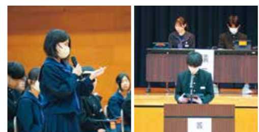
活発に発言が行われた生徒総会の様子