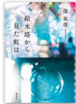
「給水塔から見た虹は」 窪 美澄 // 著 / 集英社