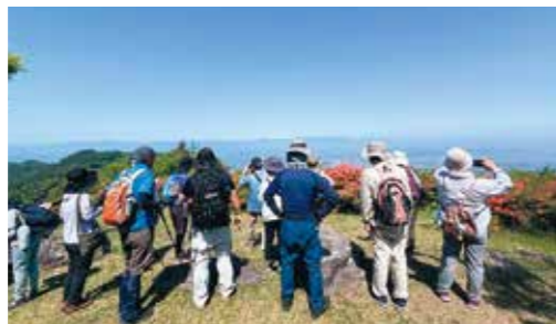
音羽山山頂でヤマツツジを楽しみ、山並みを一望する参加者(5月開催時)

6月・7月にも実施する予定で、秋にはバスを使ったフットパスも数回開催する計画をしています。興味のある人はぜひご参加ください！