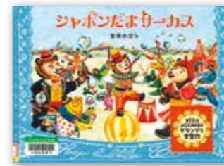
「シャボンだまサーカス」 吉田 のぼら // 作 / 白泉社