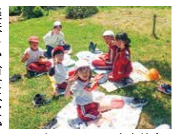
みんなでワイワイ青空給食

5月の爽やかな青空の下、今年も「青空給食」が行われました。コロナ禍で実施できない時期はあったものの、20年以上続く長島小学校の伝統行事です。全校児童が縦割り班ごとに校庭へ集まり、学年を越えて楽しそうに笑顔を交わしながらお弁当を囲む姿は、長島小学校の温かい日常を象徴する光景です。