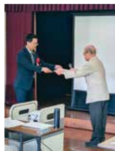
表彰状受領の様子 総会に出席した平泉文化遺産センター職員が代表して受領しました