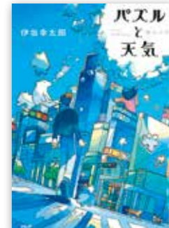
「パズルと天気」 伊坂 幸太郎 // 著 / PHP研究所